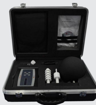
Maleta para Transporte